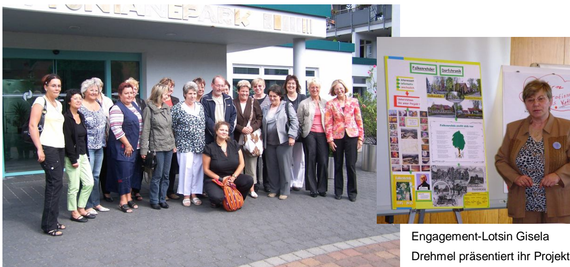
künftige Engagement-Lotsen zu Beginn der Ausbildung

Nach einer Auftaktveranstaltung Anfang September 2009, in der die Teilnehmerinnen und Teilnehmer über Ziele und Inhalte der Qualifizierung informiert wurden, startete der erste Kurs am 10. September 2009. Anfang November fand der letzte Kursteil statt. Zum krönenden Abschluss der Qualifizierung erhielten 16 Engagementlotsen Ende November 2009 ihre Zertifikate als Engagement-Lotse in einem feierlichen Rahmen im Golf-Hotel Semlin.