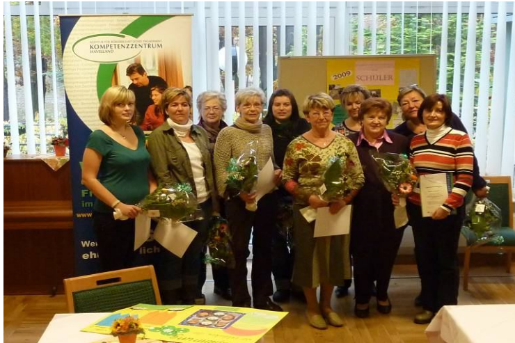
Abschlussveranstaltung der ausgebildeten Ehrenamtlichen für das Projekt „Entspannungsübungen mit Kindern“

neue Herausforderung für mich, die anstrengend war, mir aber auch sehr viel Freude bereitet hat. Die Kursteilnehmer erwarben dabei Kenntnisse zur methodischen Durchführung des Projektes. Sie fertigten selbst gestaltete Schautafeln an, die ihr erlerntes Wissen widerspiegelt und als Grundlage für die Projektrealisierung an ihren Schulen dient. In weiteren Workshops wird die Arbeit vertieft und ein regelmäßiger Erfahrungs-Austausch durchgeführt.