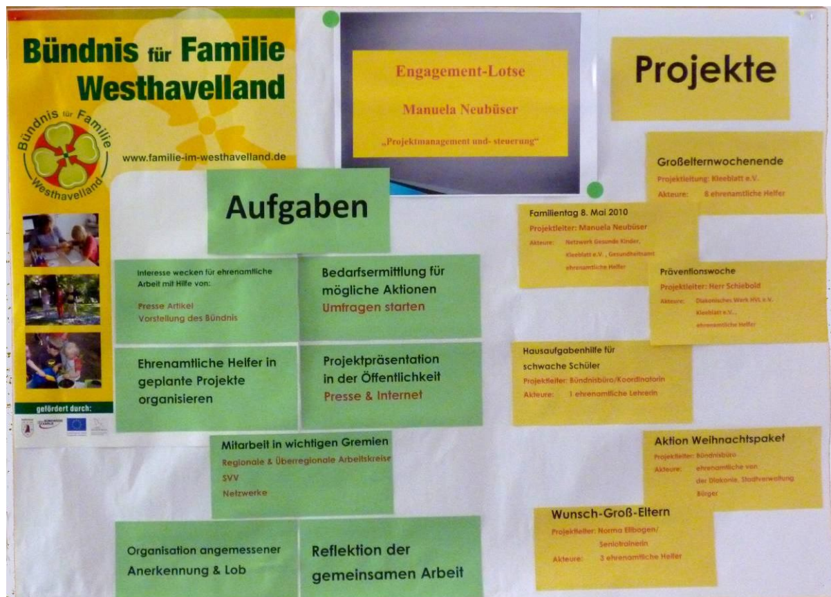
Übersicht zu Aufgaben und Projekten des Bündnisses für Familie Westhavelland

Die Qualifizierungsreihe führte ehrenamtlich engagierte Menschen aus allen Regionen des Landkreises zusammen. In Pausen während der Kurstage, aber auch in der Zeit zwischen den Qualifizierungseinheiten, tauschten sie sich über ihre Erfahrungen aus bzw. gaben sich Anregungen und praktische Tipps zur Unterstützung eines Vorhabens eines anderen Kursmitglieds. Oft fiel der Satz, man habe zwar den einen oder anderen schon gekannt. Aber das gemeinsame Beisammensein und Sprechen über die konkrete Arbeit habe einander deutlich näher gebracht.